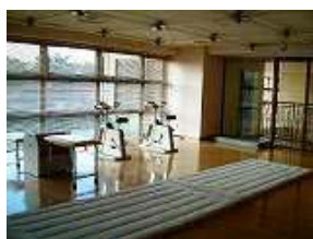
フィットネススタジオ