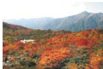
紅葉鮮やかな那須岳姥ヶ平